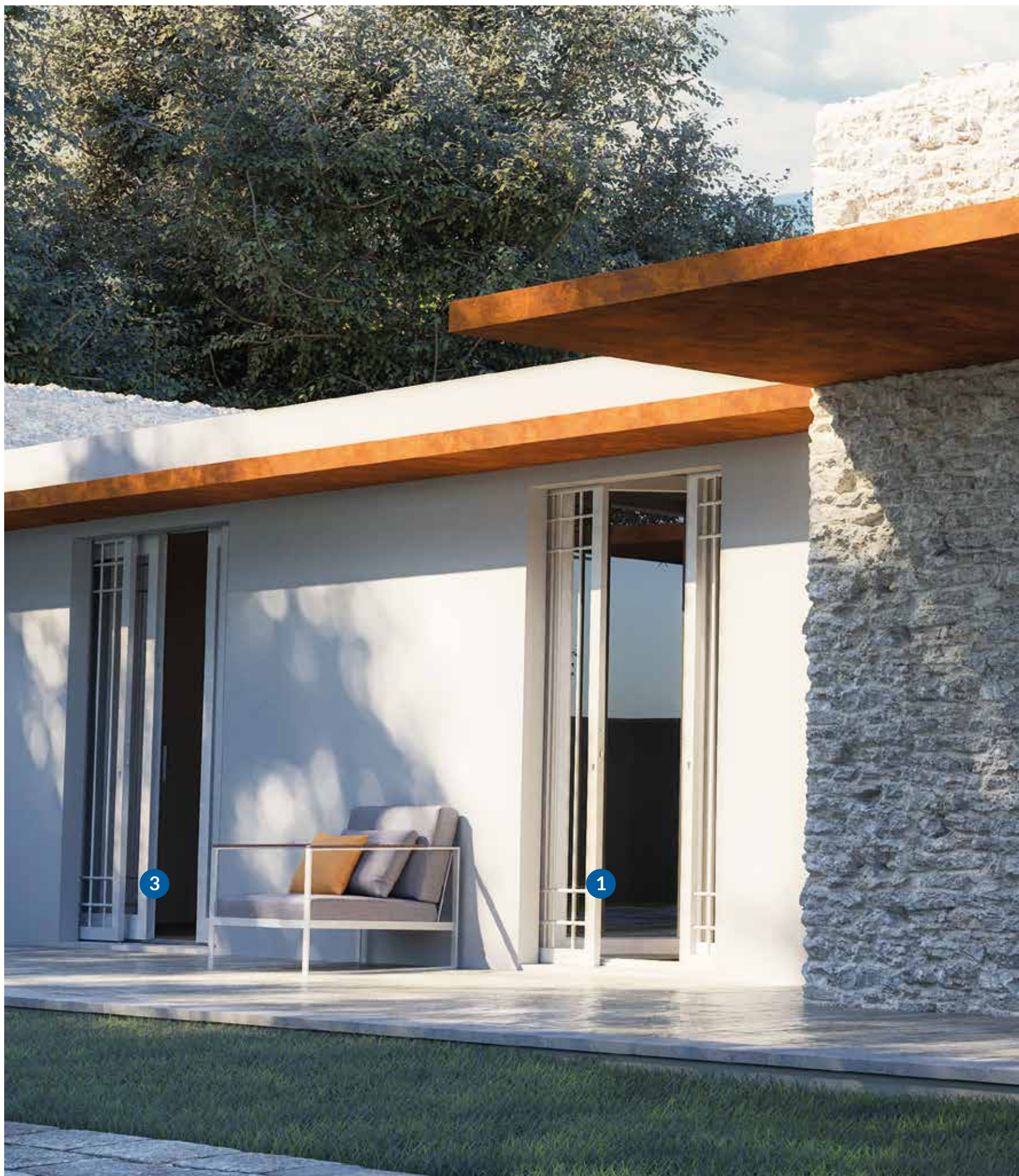
Sikuro Scorrevole con grata di sicurezza senza coibentazione